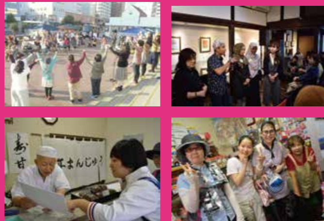
(左上)「アートインクルージョン2014」のようす / (右上)「アートインクルージョン2018」ではスマトラ沖地震の被災地インドネシア・アチェからも参加者が / (左下) 企画はまちの人とともに作り上げていきます (今はなき「豊年まんじゅう」さんと) / (右下) 展示会場のお店との間にはかけがえのない関係が生まれています。

アート・インクルージョンは2010年に長町の地で活動を開始。個人商店や公共施設、商業施設、復興住宅自治会など長町エリアのみならずと協働して地域の魅力を発掘しながら、互いのことを学び合い、支え合う関係を築いてきました。これが私たちのアートであり、生き方です。今年でまる10年がたちますが、そこに終わりはありません。